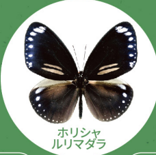
ホリシャルルリマダラ