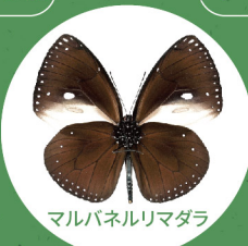
マルバネルリマダラ