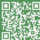
花蝶大会の 活動方法

📍 斯斯葛野式レストラン前広場 〇 当地マーケットX地元歌手X手作り体験X花蝶大会