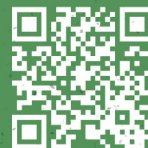
公式ファンサイト